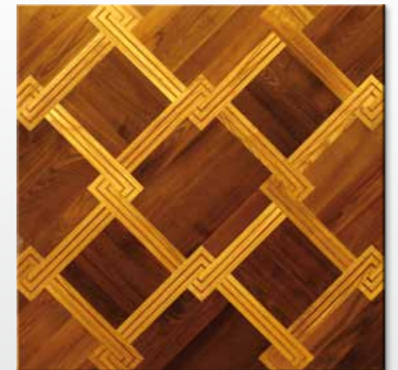
wzór słowiczyński termo