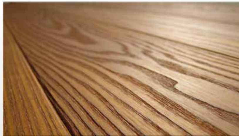
bursztyn szczotkowany olej naturalny