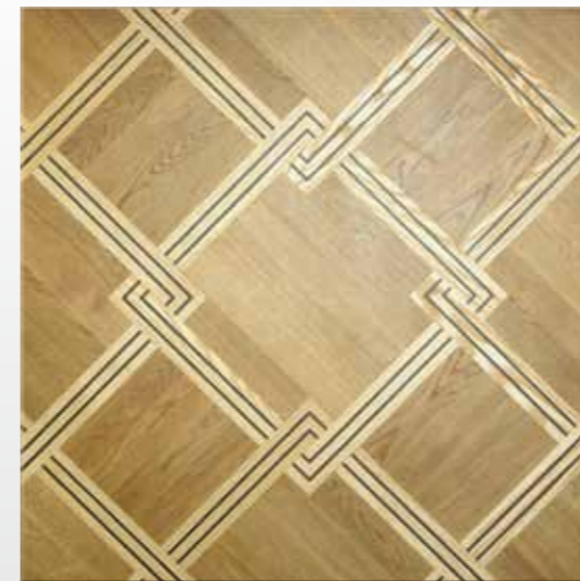
wzór słowiczyński bis