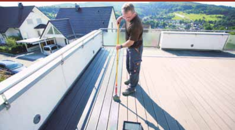
3. Aplikacja WPC-Imprägnier-Öl. Po wyschnięciu: zależnie od chłonności podłoża nałożyć drugą warstwę