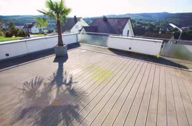
1. Podłoga tarasu przed zabiegiem